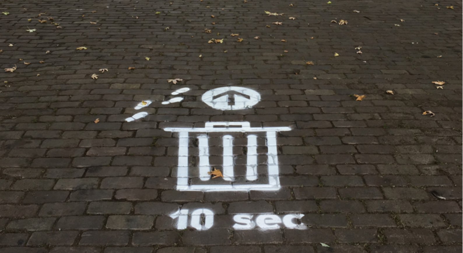
Nudge die verwijst naar een afvalbak