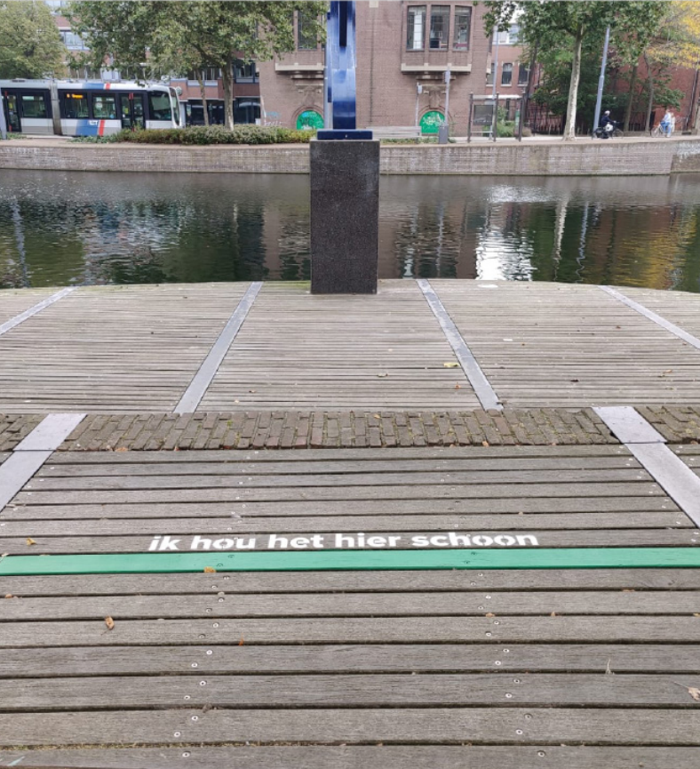
Commitment lijn op de vlonder