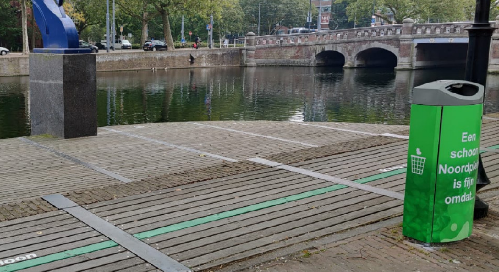
Opvallende afvalbak met zelf-overtuiging boodschap