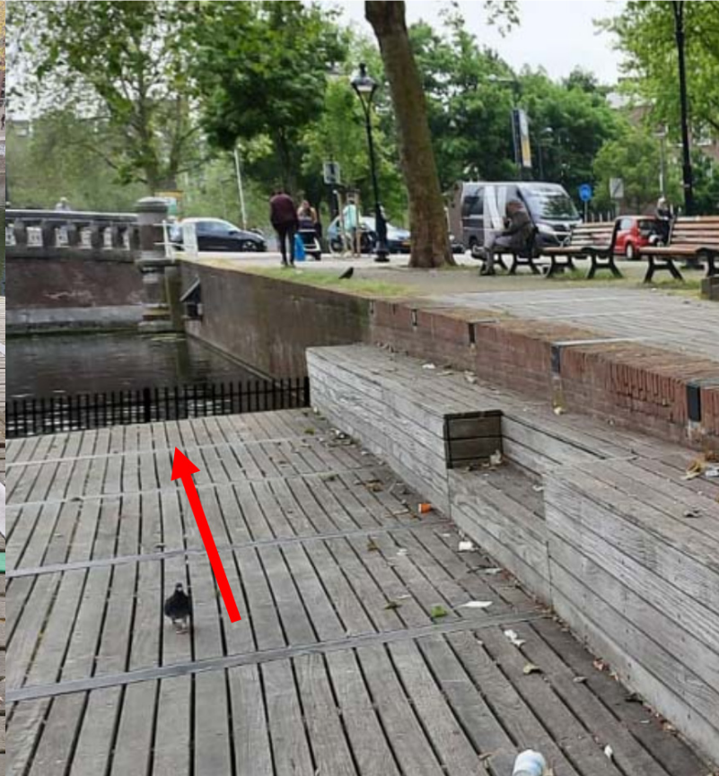
Voorbeeld van een afvalhekje aan de rand van de vlonder