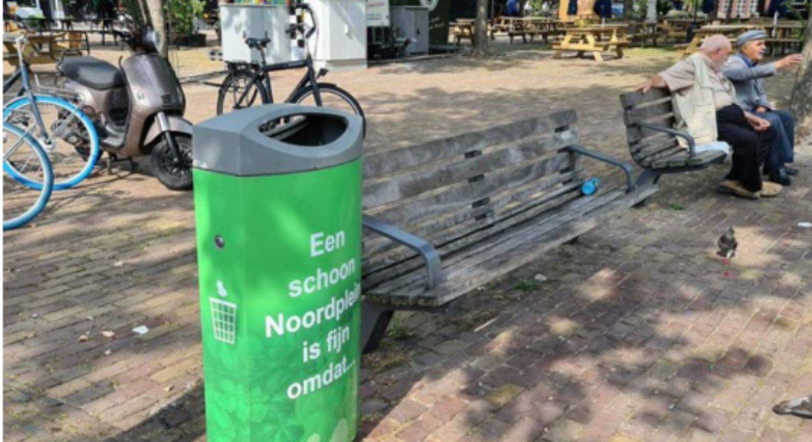
Opvallende afvalbak met zelf-overtuiging boodschap