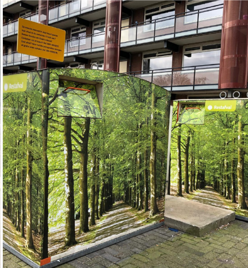
Placemaking bovengrondse container