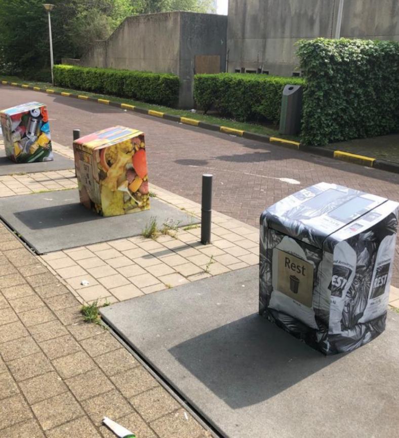
Placemaking ondergrondse containers